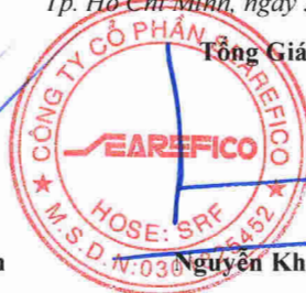
Nguyễn Khoa Đăng