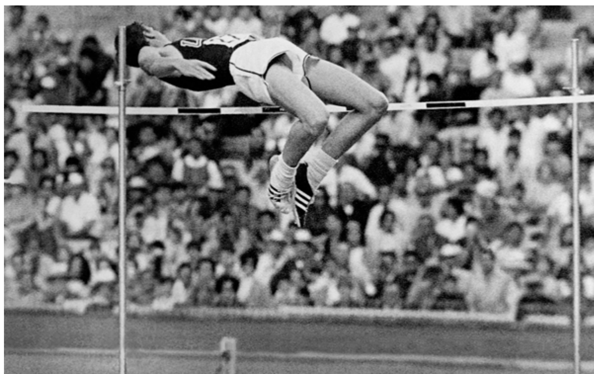
Dick Fosbury và cú nhảy kỷ tích của mình